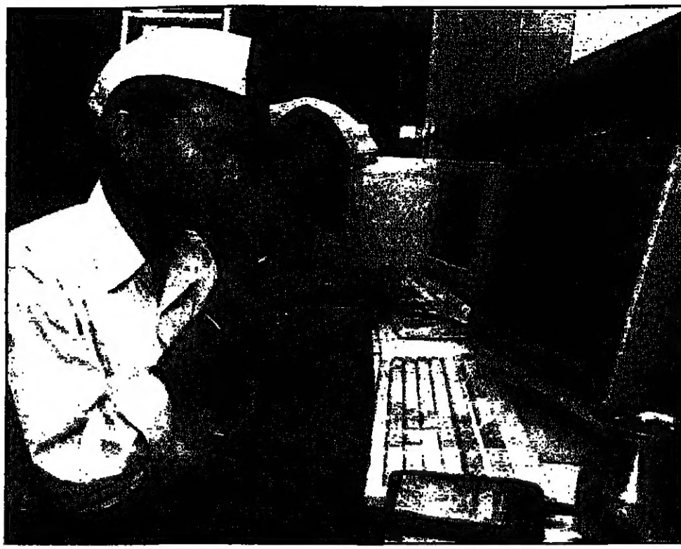
معاملاً في البورصة الهندية في يومها، يصلي أسد لاللة الثروة (لاكشميوبا) قبل بدء معاملات طابا لخط والكسب (رويت)

يتوقعون انه سيحدث مزيد من عمليات التصحيح في هونغ كونغ، لا أحد توقع ان الاتجاه (الصعودي) الذي حدث في الاسواق في هونغ كونغ سيستمر بنفس الطريقة.